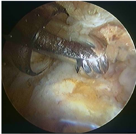
Οστεοπλαστική μείζων τοχαντήρα

Η τροχαντηρίτιδα (φλεγμονή του ορογόνου θυλάκου του μείζονα τροχαντήρα) που δεν υποχωρεί με συντηρητικά μέσα αποτελεί ένδειξη για ενδοσκοπική χειρουργική: μέσω δύο αρθροσκοπικών πυλών εκατέρωθεν του μείζονα τροχαντήρα γίνεται επισκόπηση και αφαίρεση του θυλάκου.