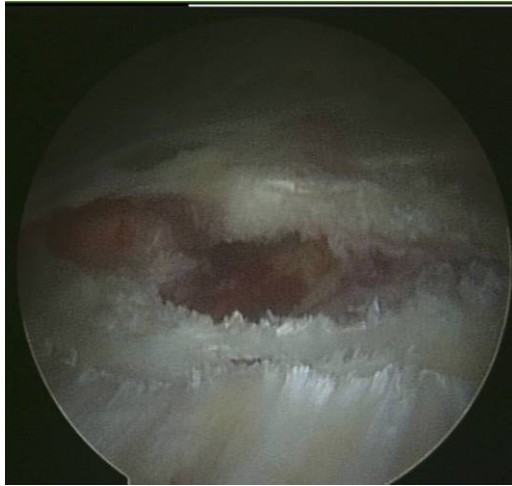
Επιμήκυνση λαγονοκνημιαίας ταινίας