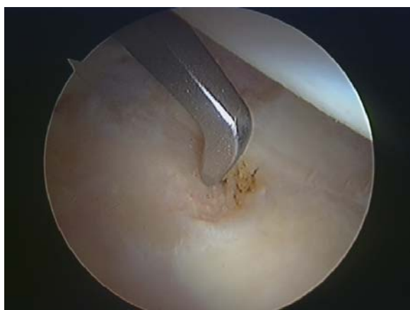
Μικροκατάγματα στην περιοχή της βλάβης. Αν ανταποκριθεί ο ασθενής η περιοχή μπορεί να καλυφθεί από ινοχόνδρινο ιστό.

Μεγάλη σημασία μπορεί επίσης να έχει στην εκτίμηση των βλαβών σε ένα νέο ασθενή με αρθρικό ισχίο, προκειμένου να αποφασισθεί η οριστική θεραπεία, καθώς είναι γνωστό ότι τα ακτινολογικά ευρήματα στην οστεοαρθρίτιδα δεν συμβαδίζουν πάντα με αυτά της αρθροσκόπησης.