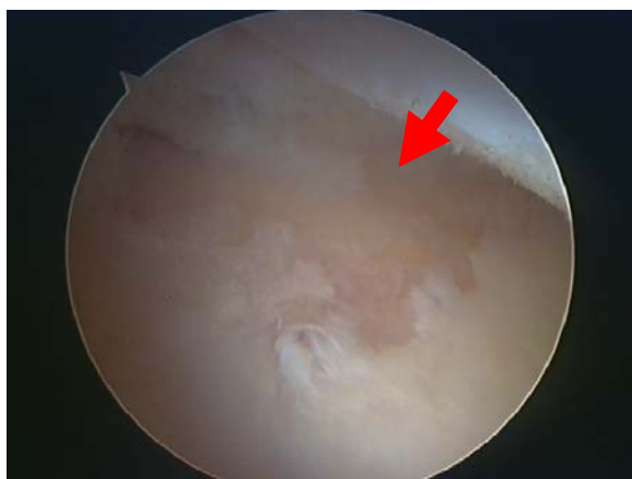
Βλάβη αρθρικού χόνδρου στην κοτύλη

Σε επιλεγμένες περιπτώσεις η αρθροσκοπική παρέμβαση στην οστεοαρθρίτιδα του ισχίου περιλαμβάνει την οστεοφυτεκτομή, τα μικροκατάγματα, αφαίρεση των ελευθέρων σωμάτων, την αφαίρεση της βλάβης μηροκοτυλιαίας πρόσκρουσης και την απόξεση των χόνδρινων κρημνών και ευρείας θυλακτομής για να αυξηθεί το εύρος κίνησης της άρθρωσης.